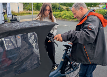
P. 19 • ÉVÉNEMENT La Fête de la mobilité revient le 7 juin

P.3 À 13 • DOSSIER SPÉCIAL ÉLECTIONS DÉCOUVREZ QUI SONT LES ÉLUS DE LA COMMUNAUTÉ DE COMMUNES