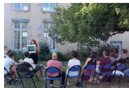
P. 21-23 • ÉTÉ Zoom sur les activités touristiques

JUIN JUIL. AOÛT SEPT. 2026 Journal du Pays de Pouzauges