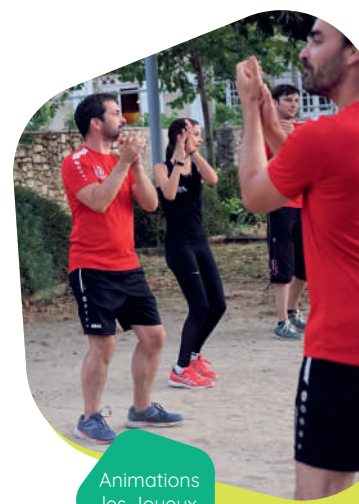
Animations les Joyeux Vendéens