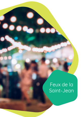
Feux de la Saint-Jean

19h - Château de La Flocellière - SÈVREMONT