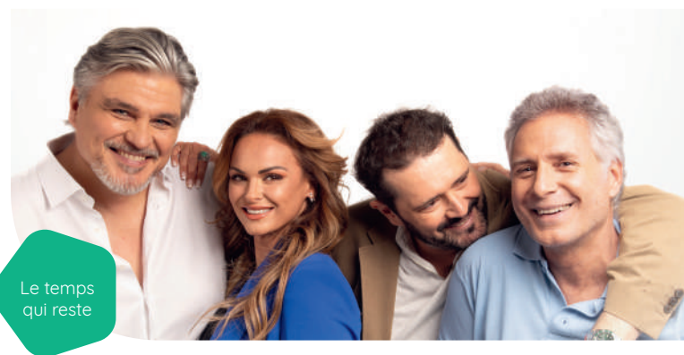
Le temps qui reste

L'ÉCHIQUIER cinéma spectacle PAYS DE POUZAUGES