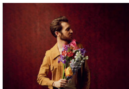
P. 20 • CULTURE L'Échiquier lève le voile sur sa programmation 2026-2027