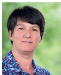
Séverine DIGUET-HERBERT Maire de Saint-Mesmin