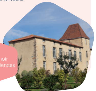
Manoir des sciences

Journées du patrimoine 14h-18h le samedi 10h30-18h30 le dimanche Tarifs réduits