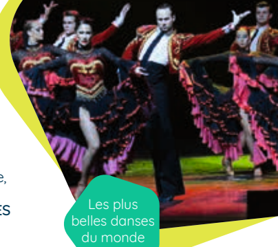
Les plus belles danses du monde

20h30 le samedi ; 15h le dimanche Théâtre des Châtelliers-Châteaumur - SÈVREMONT