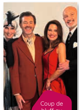
Coup de bluff au cabaret