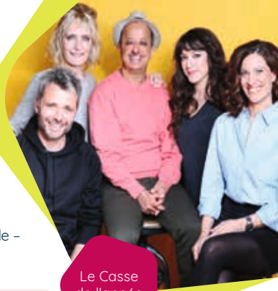
Le Casse de l'année